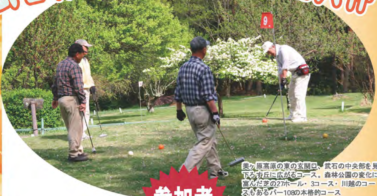
美ヶ原高原の東の玄関口、武石の中央部を見下ろす丘に広がるコース。森林公園の変化に富んだ芝の27ホール・3コース・川越のコースもあるパー108の本格的コース